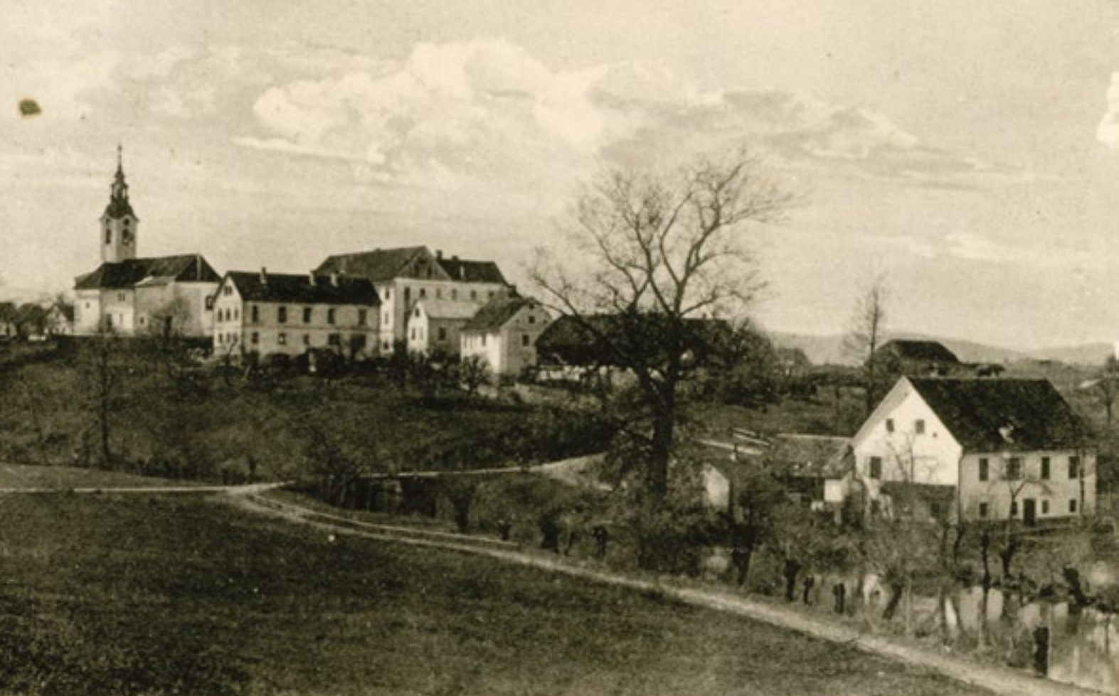
Župnijska cerkev, samostan in okolica Šmihela ob Težki vodi, 1912

Hrani: Knjižnica Mirana Jarca Novo mesto.