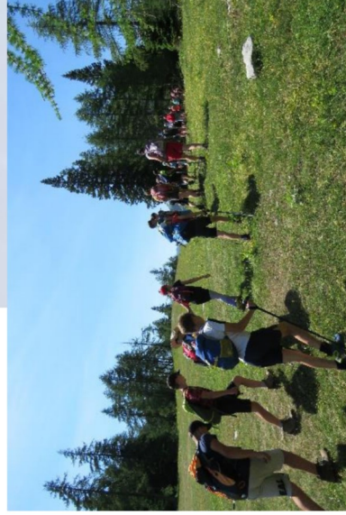
Založilo: PD Krka Novo mesto Grafično oblikovanje: Andreja Bartolj Bele

Pripraviti tabor, ki bo otrokom prijazen, ni lahka naloga. Zavedamo se organizacijskih in izvedbenih nalog, ki bodo mladim planincem omogočale sklepanje novih prijateljstev, prijetno druženje v naravi in nova znanja in izkušnje. Za vse te cilje bo poskrbela izkušeno vodstvo, mladinski planinski vodniki, mentorji in gostitelji, ki bomo s skupnimi močmi pripravili nepozabno doživetje v objemu gora.