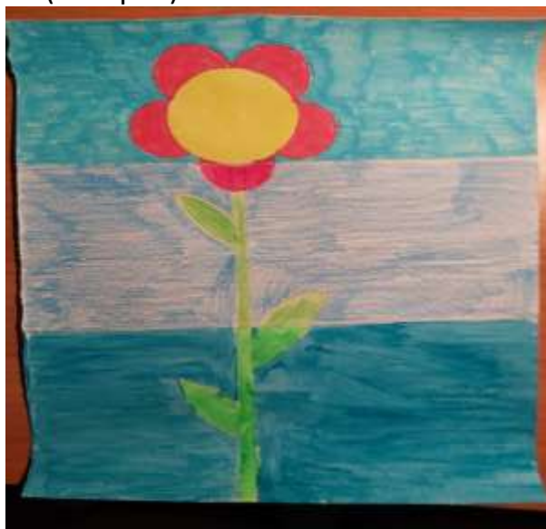
Vir: Klara Hudoklin