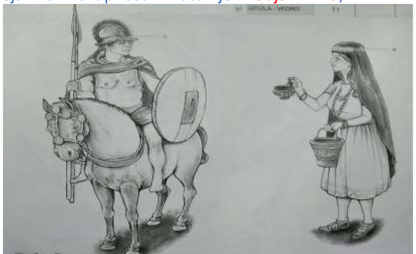
Halštatski knez in kneginja

V Novem mestu je bilo odkritih več grobov halštatskih knezov. Knez je bil najbogatejši in najmogočnejši mož v skupnosti in zato njen vodja v miru, v vojni pa vojaški poveljnik .