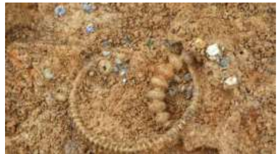
Tako je videti grob med