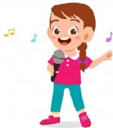
PEVKA (POJE PESMI)