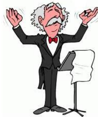
ZBOROVODJA (VODI, USMERJA PEVSKI ZBOR)