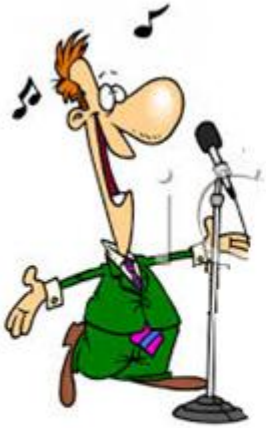
PEVEC (POJE PESMI)

POGLEJ SLIČICE IN PROSI STARŠE, DA TI PREBEREJO, KAR PIŠE POD NJIMI. NATO SAM POIMENUJ ČIM VEČ SLIČIC BREZ POMOČI. (ČE ŽELIŠ IN IMAŠ MOŽNOST LAHKO NATISNETE IN PRILEPIŠ V ZVEZEK ALI PA PRERIŠEŠ)