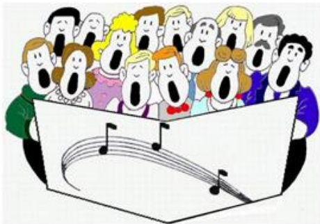
PEVSKI ZBOR (SKUPINA PEVCEV, KI POJEJO SKUPAJ)